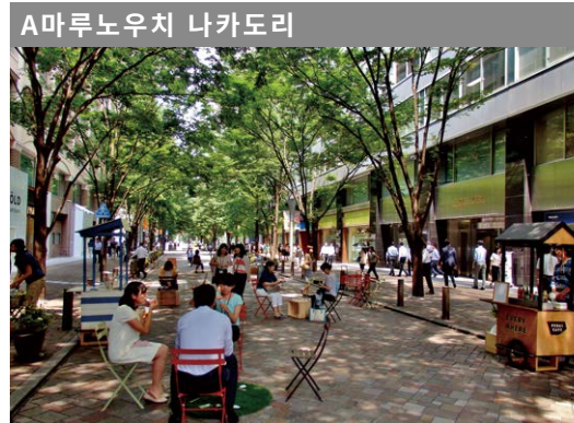
A마루노우치 나카도리 차량통행 금지시간 평일: 오전 11시~오후 3시 휴일: 오전 11시~오후 5시