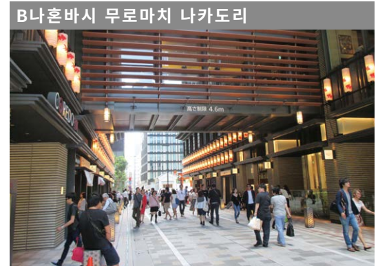
B나혼바시 무로마치 나카도리 차량통행 금지시간 평일, 휴일: 오전 11시 ~오후 8시