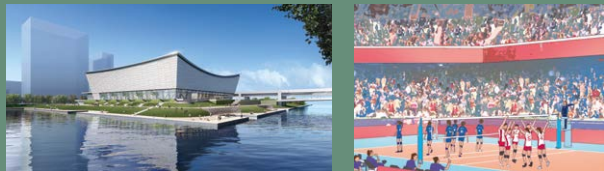
8 아리아케 아레나 ※