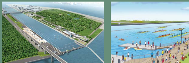
16 16우미노모리 수상경기장 ※

※ 원쪽 그림은 모두 2015년 10 월 시점의 대회 당시의 시설 이미지