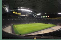
31 삿포로 돐