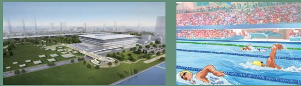
19 올림픽 아쿠아틱센터 ※

대회 후에도 경기 스포츠의 거점으로서 스포츠 이용·관전을 비롯하여, 청소년 교육의 장소 등에 유효하게 활용될 것입니다.