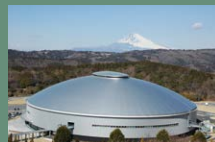
30 이즈 벨로드롬