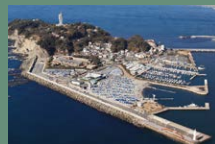
28 에노시마 요트하버