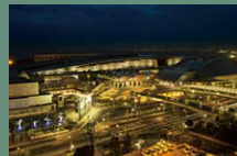
27 마쿠하리 멧세