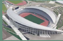
32 미야기 스타디움