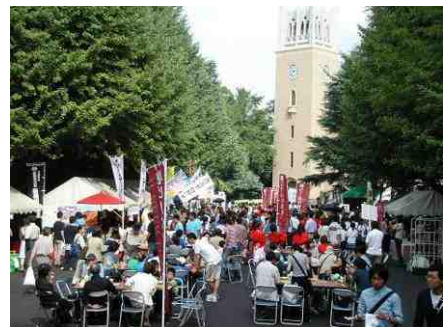
早稲田地球感謝祭 2013

毎年9月に早稲田キャンパスを主会場として開催される地球感謝祭は、イベントをきっかけにまちをかえていくというコンセプトをもとに開催され、3万人を越す来場があります。