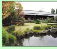
柴又帝釈天題経寺大客殿 （葛飾区）