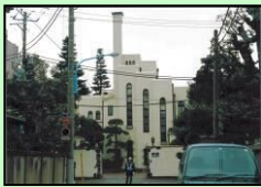
日立目白クラブ（新宿区）