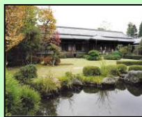
柴又帝釈天題経寺大客殿 （葛飾区）