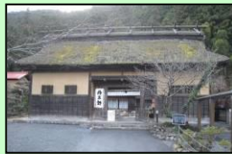
丹三郎屋敷長屋門（奥多摩町）