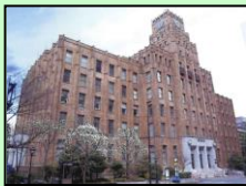
市政会館（千代田区）