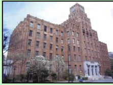
市政会館（千代田区）