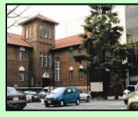
早稲田奉仕園(新宿区)