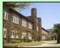
立教大学本館【モリス館】（豊島区）