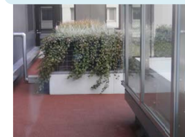
写真④ 9階屋上部の庭園

供給される再生水の残留塩素濃度が低い場合に備えて設置している。塩素濃度が低い場合に、自動で塩素が供給される。