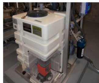
写真③ 塩素注入装置

マンホールの下は、水再生事業所から供給された再生水を貯留する地下ピットの貯留槽。