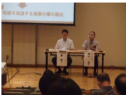
パネルディスカッションの様子(近景2)