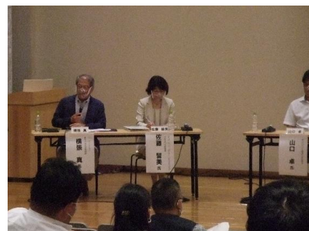
パネルディスカッションの様子(近景1)