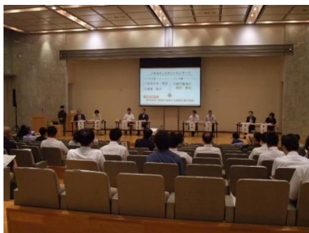
パネルディスカッションの様子(遠景)