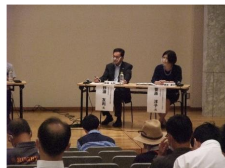
パネルディスカッションの様子(近景3)