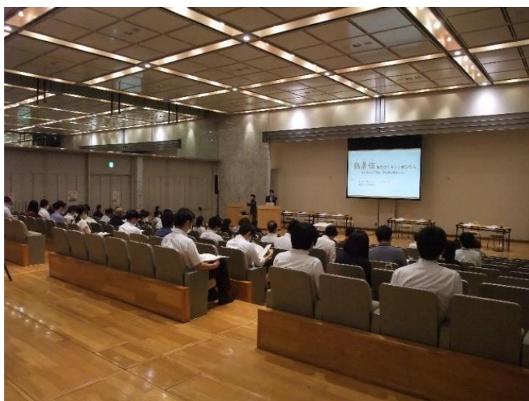
当日のシンポジウム会場の様子

そこで、各地域における「緑農住」まちづくり推進に向け、緑農地で様々な活動を展開している方々からお話を伺うとともに、「緑農住」まちづくりに関する課題や疑問点を議論し、解決策やヒントを見つけるための「緑農住まちづくりシンポジウム」を開催しました。