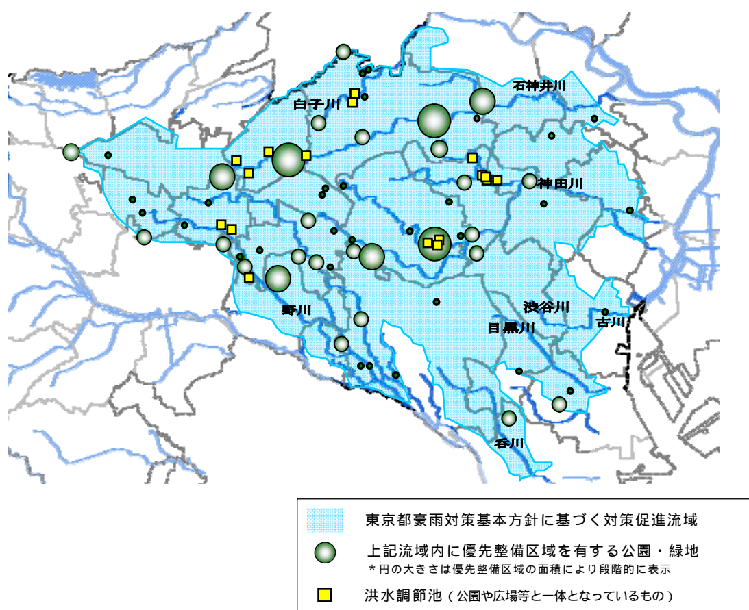
<図表3 - 17 東京都豪雨対策基本方針に定める対策促進流域に優先整備区域を有する公園・緑地>