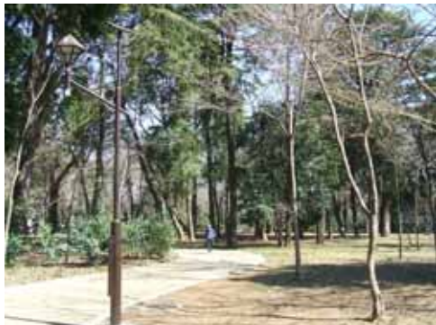
◇市街地における公園は避難場所として不可欠な存在（北江古田公園：中野区）