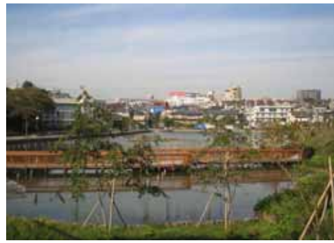
◇湧水や池を生かした地域のシンボルと なっている公園(洗足小池公園：大田区)