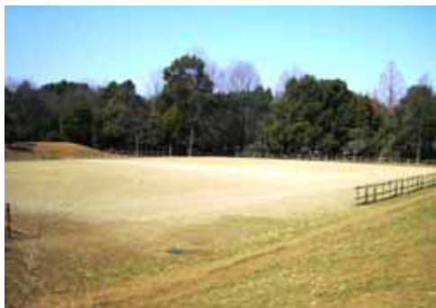
◇芝生広場の地下には雨水の浸透施設が設置されている（光が丘公園：練馬区）