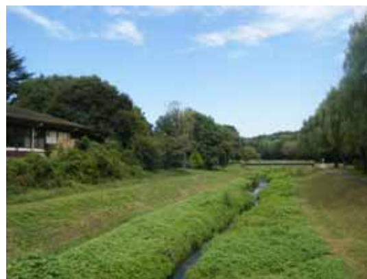
◇河川沿いの緑と公園の緑が一体化した、水と緑のネットワーク（野川と野川公園：三鷹市、調布市、小金井市）