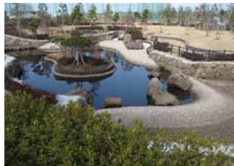
◇豪雨時のオーバーフロー水を地下に浸透させる構造を持った池（武蔵野の森公園：調布市）