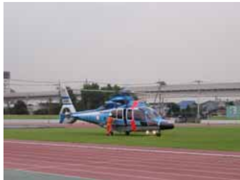
◇大規模救出救助活動拠点指定された公園における防災訓練（舎人公園：足立区）