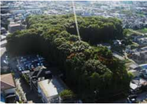
◇地域の景観を特色付ける、市街地に残るま まりのある樹林地(西恋ヶ窪緑地：国分寺市)