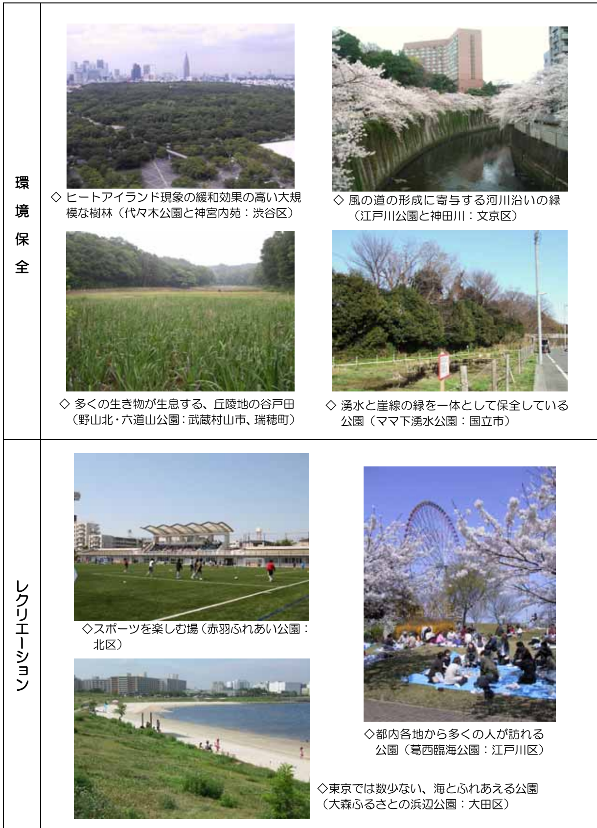
<図表3 - 7 機能・役割と公園・緑地の例 環境保全、レクリエーション、景観・魅力>