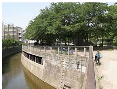
◇洪水調節池の整備と公園が連携している例（壁面に開いているのは取水口）（左 比丘尼橋下流調節池と大泉町公園（大泉橋戸公園）：練馬区 右 落合調節池と落合公園：新宿区）