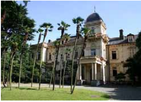
◇和洋の文化の対比が特徴的な庭園 (旧岩崎邸公園：文京区、台東区)