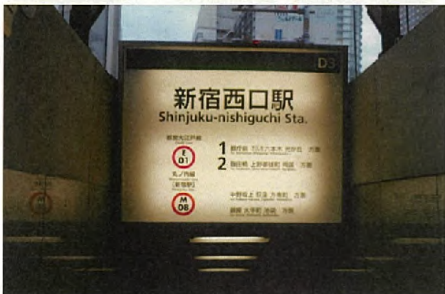
西-5004<片面> 表示面寸法H1195×W1495 (和文文字高130,100)