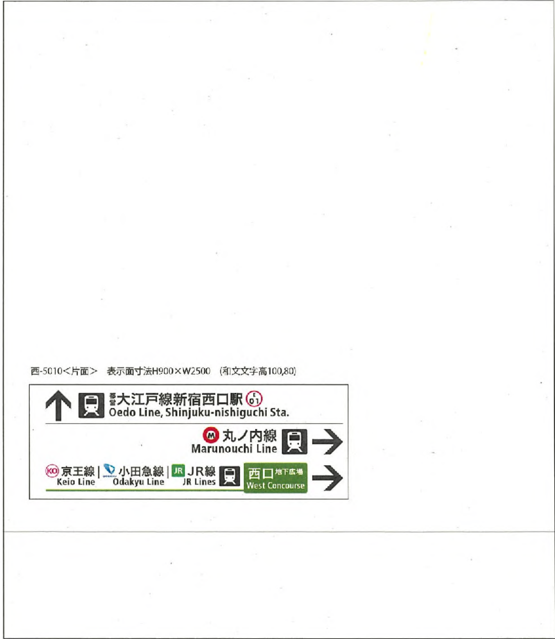
西-5010<片面> 表示面寸法H900×W2500 (和文文字高100,80)