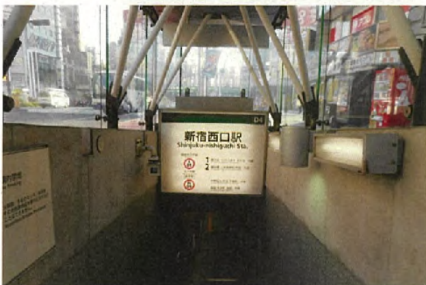
西-5006<片面> 表示面寸法H1195×W1495 (和文文字高120,100)