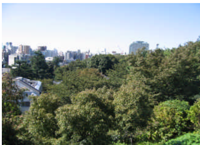
みどりがネットワークされた市街地

崖線に残されたみどりの連なりの中にまちが形成され、都市と自然が調和したみどりの軸が形成されている (目黒川沿いの崖線：代官山)