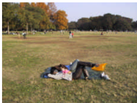
多摩部の広域のみどりの拠点 （小金井公園：小金井市）