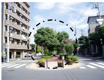
◇ 地域の道路において、道路中央部に緑道公園が設置されている。両側は1車線道路（江戸川区）