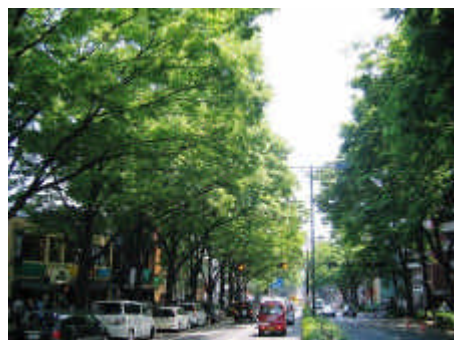
区部の広域のみどりの軸 （表参道：渋谷区・港区）