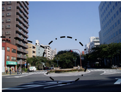
◇ 広幅員の幹線道路において、中央分離帯の位置に桜並木を有する緑道を整備。両側は2車線道路（環3：播磨坂：文京区）