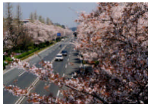
多摩部の地域のみどりの軸 （大学通り：国立市）