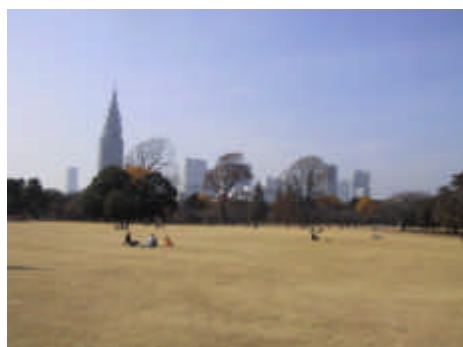
区部の広域のみどりの拠点 （新宿御苑：新宿区）