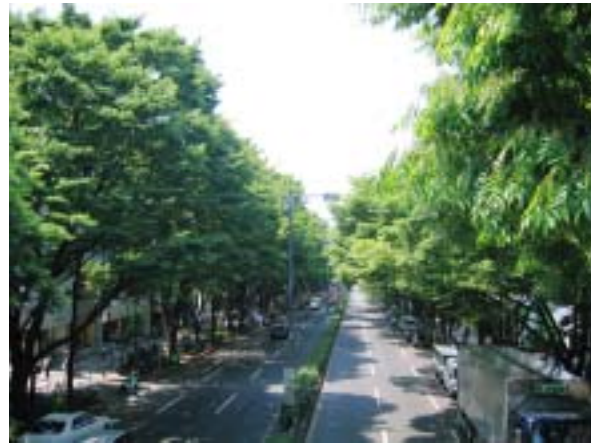
みどりの軸の例(道路や河川、崖線のみどりなど) 【表参道の街路樹】