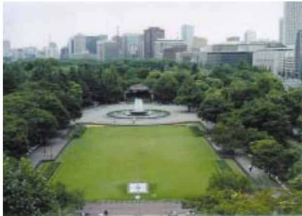
みどりの拠点の例(公園・緑地など) 【日比谷公園】