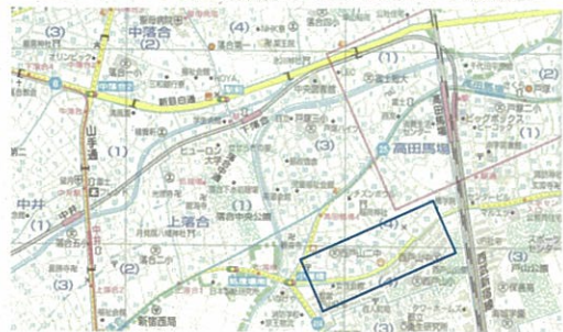
昭文社、「東京区分地図2001年版、新宿区より作成『地図使用承認©昭文社第 10E006号』