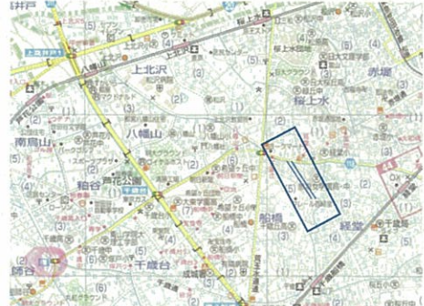
昭文社、「東京区分地図2001年版、世田谷区より作成『地図使用承認©昭文社第 10E006号』