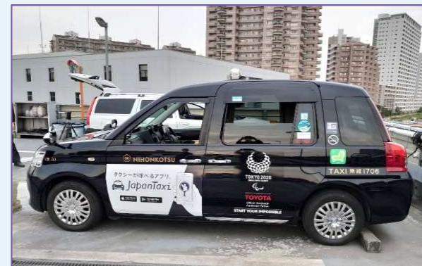
UDタクシー（ジャパntaxi） 全長×全幅×全高 =4,400mm×1,695mm×1,750mm