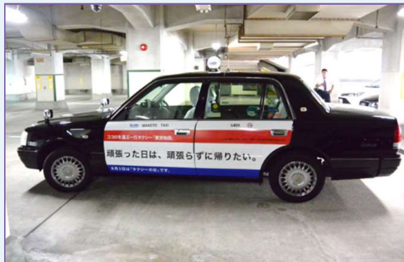
セダンタイプタクシー 全長×全幅×全高 =4,690mm×1,695mm×1,525mm