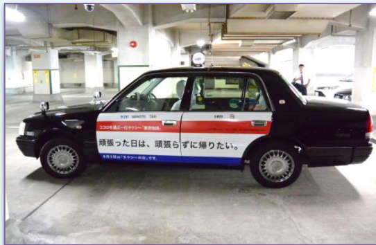
セダンタイプタクシー 全長×全幅×全高 =4,690mm×1,695mm×1,525mm