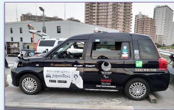
UDタクシー（ジャパンタクシー） 全長×全幅×全高 =4,400mm×1,695mm×1,750mm