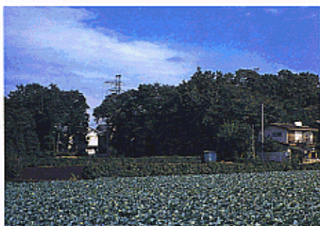
武蔵野の農地と雑木林（保谷市）

東京は消費都市として考えられがちですが、その基盤をささえている農林水産業や工・鉱業の存在も大きいものがあります。これらの産業が生み出す景観は、産業景観として、東京の景観の重要な要素です。地域のくらしと一体となった、良好な産業景観を育成していきます。