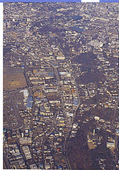
多摩川台の崖線（世田谷区）

山地、丘陵地、台地、低地から東京湾につながる大きな地形の構造、台地と低地を区切る崖線のつながり、坂の多いまちを生み出しているヒダの多い微地形などは、かけがえのない自然の恵みです。こうした大地の構造を東京らしい景観を生み出す手がかりとして重視していきます。