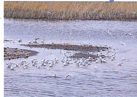
バードサンクチュアリ（東京港野鳥公園：大田区）

奥多摩や島しょの自然を大切にするとともに、自然の少ない市街地では自然の保護と回復につとめ、水と緑と土を手がかりとして生態系の秩序をとりもどし、人と生きものが共生できる都市をつくりまします。