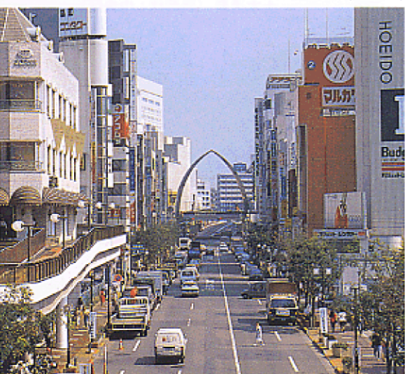
町田の中心部（町田市）