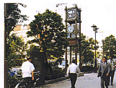
架空線を地中化した商店街（中央区）