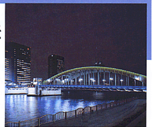
土木遺産（勝鬃橋：中央区）

江戸・明治・大正・昭和時代の名残りをとどめる歴史的建築物や土木遺産、また、武蔵野の雑木林や各地に伝わる祭りなどは、東京の原風景を代表するものです。これらの歴史と風土に培われた原風景は、都市の記憶を次の世代に引き継ぐための重要な手がかりとして、また都市のアイデンティティやクオリティなど都市の魅力をたかめるものとして、保全活用をはかります。