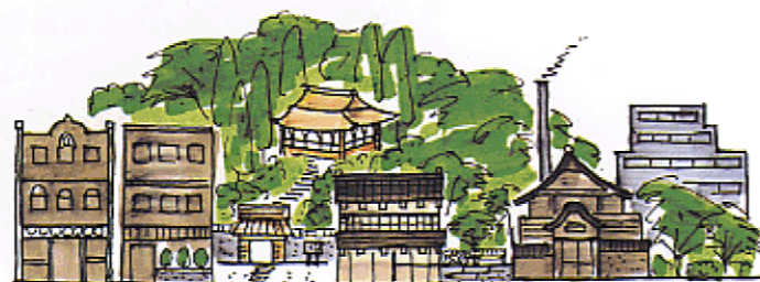
歴史的景観資源を生かした街づくりをすすめる

商業・業務・文化機能の集積地や交通結節点である都心、副都心、多摩の「心」及び地区中心は、都市活動を支える重要な地域であり、また、周辺地域の景観形成の先導役でもあります。地域特性を生かした個性豊かな都市景観の形成をすすめていきます。