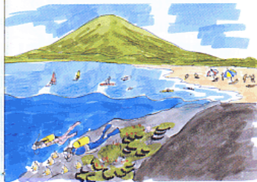
豊かな自然を楽しむレクリエーションエリアをつくる