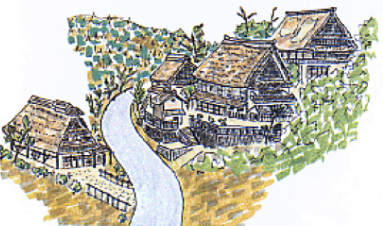
伝統的な集落景観を景観資源として生かす