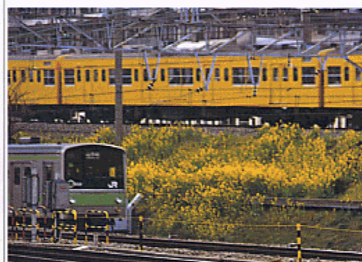
鉄道敷地に彩りを加える草花（新宿区）

また、多くの人々が毎日、車窓からの風景を楽しむことができるよう、路線沿いの緑化や修景をすすめます。