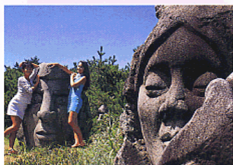
特産の抗火石を使ったモヤイ像（新島村）