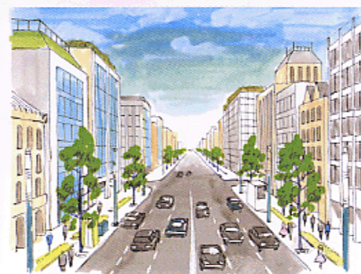
景観を配慮したシンボルロードをつくる