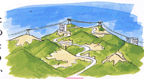
山なみや後線のスカイラインを大切に

多種多様な屋外広告物や頭上に張り巡らされた架空線は、まちの景観を阻害している場合があります。これらの景観阻害要因を取り除き、美しい景観を取り戻していきます。