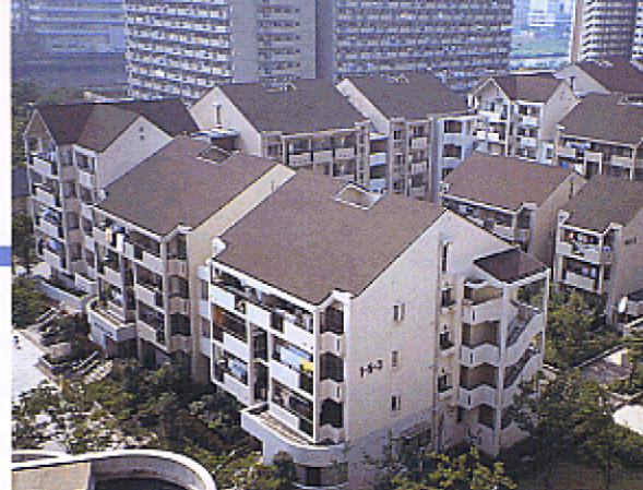
再開発による新しい住宅地（江戸川区）

市街地のほぼ半分を占める住宅地には、下町、山の手、郊外とそれぞれの地域特性に応じた多様な形態があり、また常に変化しています。東京都住宅マスタープランとの整合をはかりながら、住民の創意と工夫によって、地域特性に応じた落ちついて、調和のとれた街並みをつくり育てていきます。