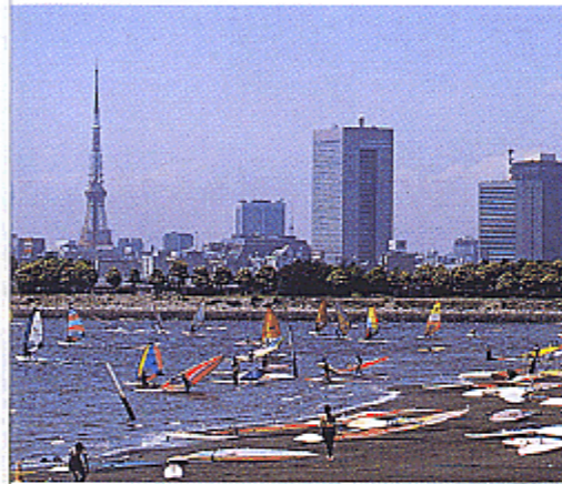
水際線の開放（お台場海浜公園：港区）

東京湾は東京を、産業、物流、環境、レクリエーションなどの各面で支えています。東京湾をくらしに密着したものとするために、海と市街地との結びつきを強め、魅力ある海辺の景観を生み出していきます。また、伊豆諸島や小笠原諸島の美しい海岸線はかけがえのないものであり、これらの自然景観の保全につとめます。