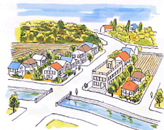
風景に調和した住宅地を育成する