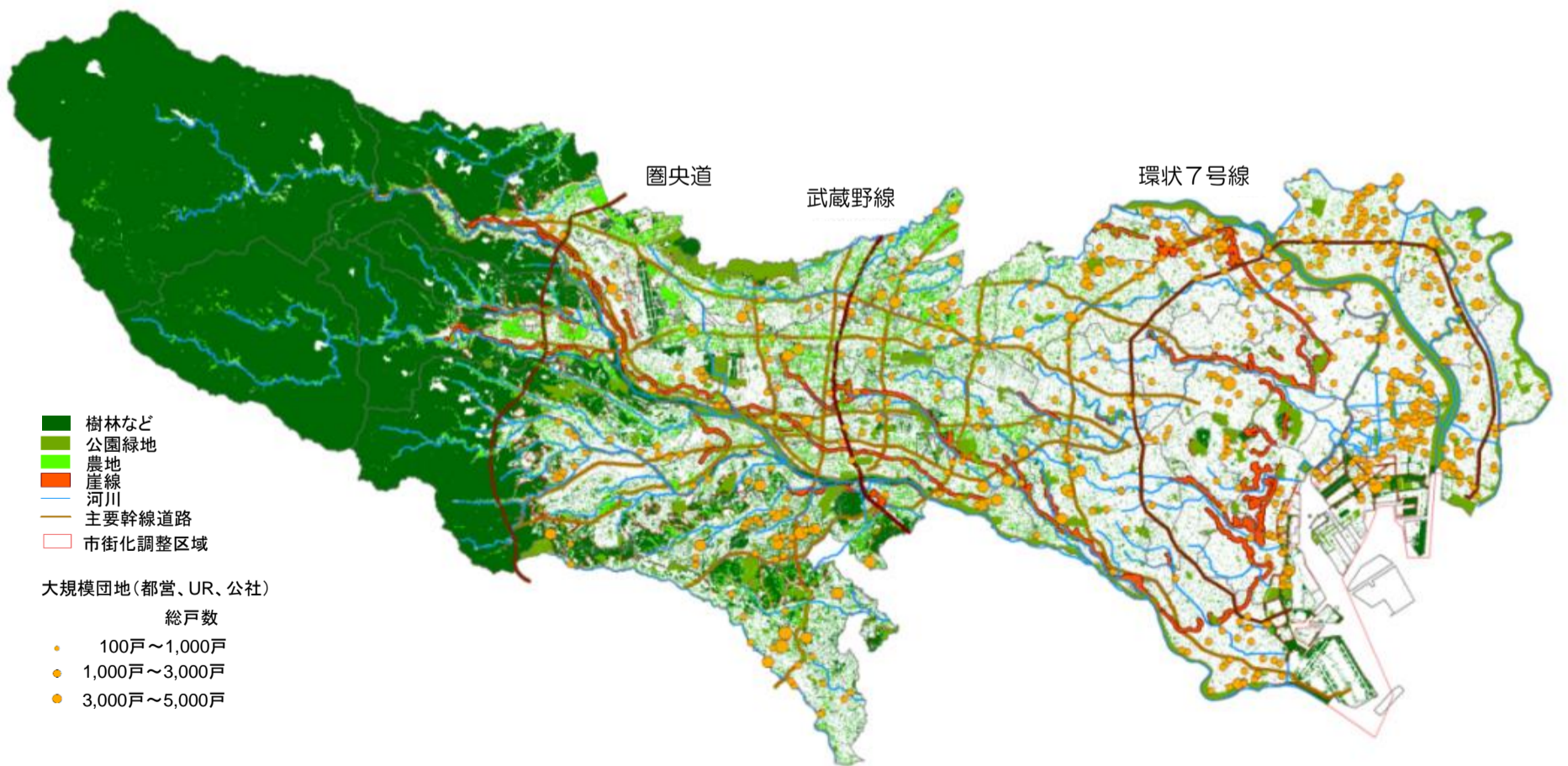
図2 東京のみどり等の現況