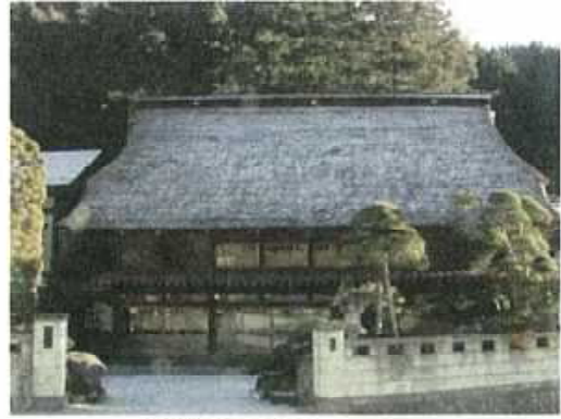
兜造りの民家（檜原村）

街道沿いの集落には、社寺が点在するほか、江戸末期の山間部落の娯楽施設として、農民の手によって建てられた太子堂舞台など、史跡も多く、集落に固有の素朴な行事も伝わっている。国の重要文化財に指定された旧小林住宅を始め、古くから地域に根ざした生活文化を反映する古い民家が散見される。檜原村数馬地区のように、兜造りの民家が残る、特徴ある景観を形成している地区も見られる。