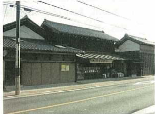
旧街道の街並みを生かした景観形成（青梅市）