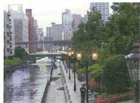
水辺空間の再生・創出(新芝運河)