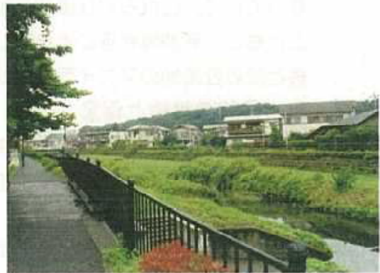
国分寺崖線 づい 等の緑の保全（野川沿い）