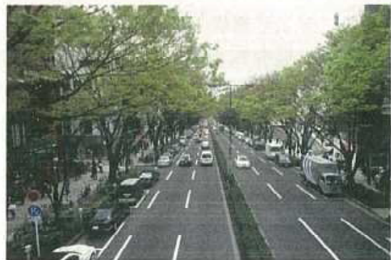
主要な幹線道路における修景（表参道）