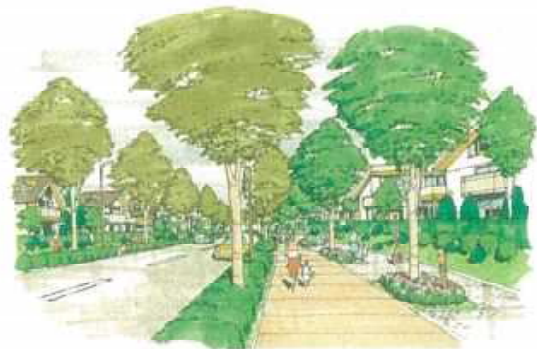
幹線道路の整備による統一感ある街並み