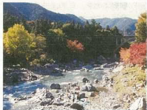
自然と調和したレクリエーション・ゾーン（御岳渓谷）