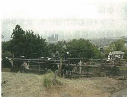
市街地に残る農地の保全 (東京「農」の風景・景観コンテスト 平成18年度都市整備局長賞)