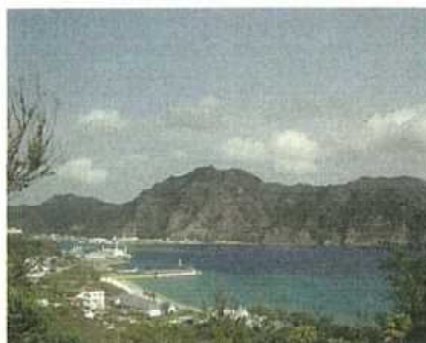
自然や風土と調和した景観形成（小笠原村父島）