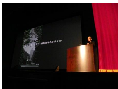
講演会（早大大隈記念講堂）