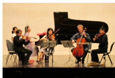
コンサート（早大大隈記念講堂）