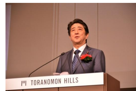
安倍内閣総理大臣祝辞