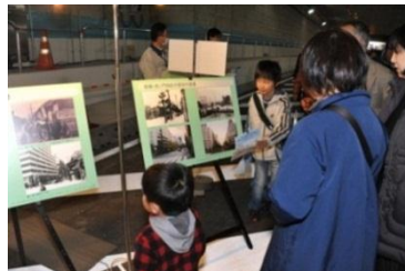
アーカイブ写真の展示

環状第2号線(新橋・虎ノ門間)の開通に先立ち、本年3月23日(日)に環状第2号線地下トンネルのウォーキングイベントを実施いたしましたので、当日の様子をご報告いたします。