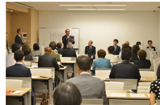
お引渡し会場の様子

その後、権利者の方々に、鍵の種類・取扱、設備の取扱説明書等のお引渡し書類の説明を行い、書類の受領を確認した後、住宅・オフィス等の各区画へ移動し、権利者の皆様が各扉の鍵を確認し、お引渡しがすべて完了いたしました。