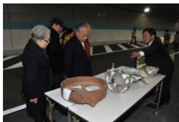
出土した埋蔵文化財の展示