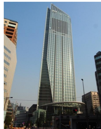
Ⅲ街区(虎ノ門ヒルズ)

また、5月30日(金)には、権利者の皆様への鍵のお引渡しを、虎ノ門ヒルズ森タワー37階虎ノ門ヒルズレジデンス集会室にて行いましたので、当日の様子をご報告いたします。