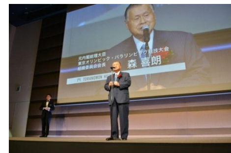
森会長の挨拶・乾杯