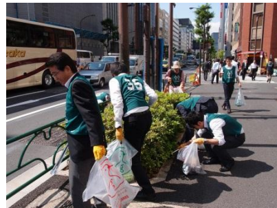
新虎通り周辺の清掃の様子

今後も引き続き実施しますので、地域の方々にはご理解・ご協力のほどよろしくお願いいたします。