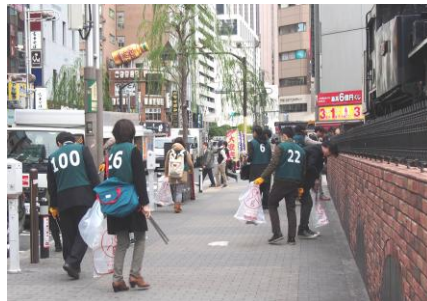
新橋駅周辺の清掃の様子

今後も、引き続き試行的に清掃活動を実施する予定ですので、地域の方々にはご理解・ご協力のほどよろしくお願いいたします。