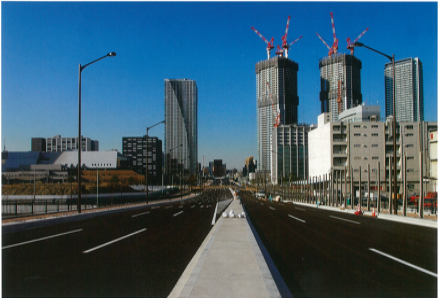
整備中の環状第2号線の豊洲大橋側から晴海五丁目交差点方面を臨む（平成26年12月撮影）