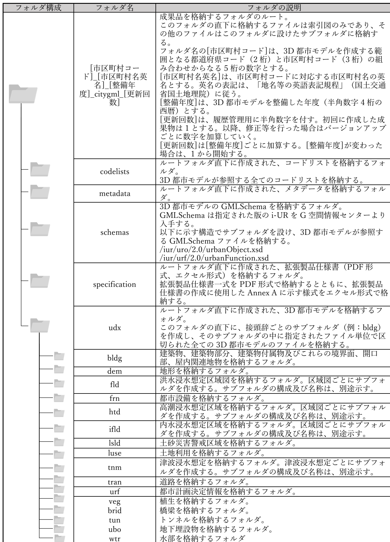
表 7-5 フォルダ構成