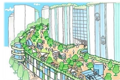
地区間をつなぐ歩行者ネットワークが創出されます。