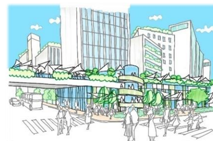
見る・見られる都市の魅力が生まれます。