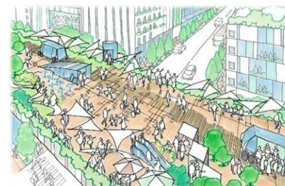
まちを眺めて楽しめる新しい都市の視点場となります。