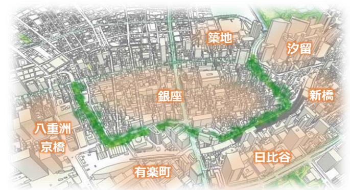
東京高速道路の位置図