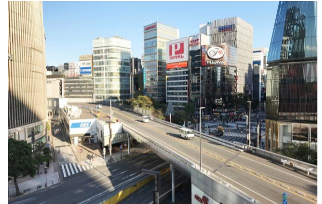
現在の東京高速道路（数寄屋橋交差点部）

本方針は、検討会から提言された、K K線の再生・活用の目標、目指すべき将来像、整備・誘導方針を都の方針として定め、あわせて再生に向けて高架施設の位置付けや事業スキームの考え方、今後の進め方を示すものです。