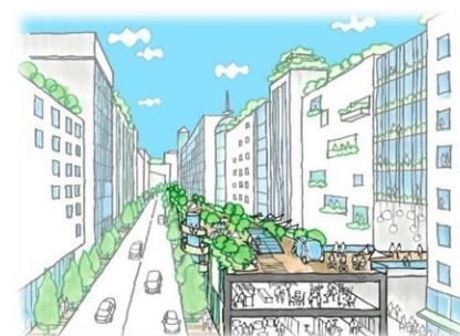
地上や周辺施設と重層したネットワークが創り出されます。