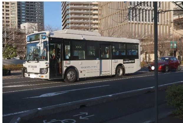
図 2-2 柏の葉地区における取組状況の写真

本ガイドラインでは、柏の葉地区でのレベル 4 実装に向けたロードマップを参考とし、「レベル 2 実証運行」ステップの開始から「レベル 4 本格運行」が開始可能になるまでの期間を 4 年程度と想定しています。