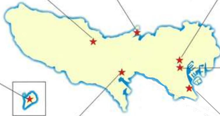
多摩サービス補助施設