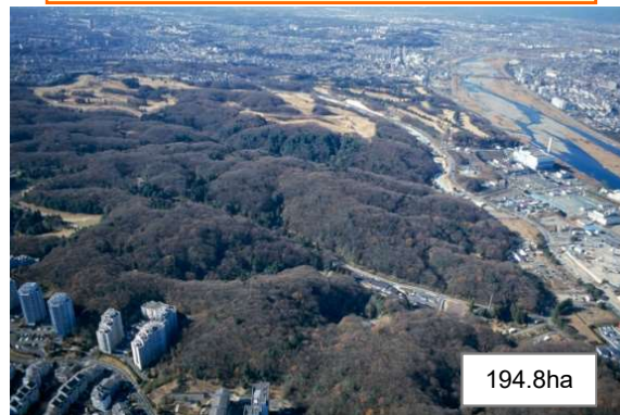
多摩サービス補助施設