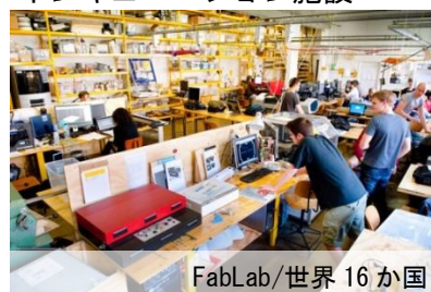
インキュベーション施設