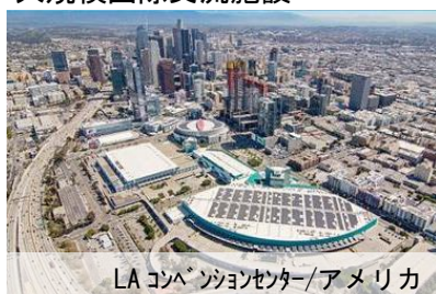
大規模国際交流施設