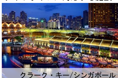
ナイトライフに対応する施設